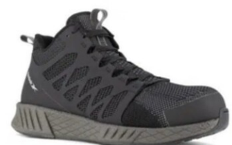
RBMX318 FUSION FLEXWEAVE™ WORK DAMA DIELÉCTRICO TALLAS 22-27 MEX