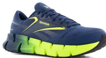
RBMX3032 FLOATZIG WORK DIELÉCTRICO TALLAS 25-32 MEX