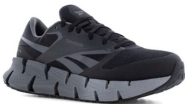
RBMX3031 FLOATZIG WORK DIELÉCTRICO TALLAS 25-31 MEX