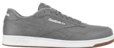
RBMX4151 CLUB MENT WORK GRIS DIELÉCTRICO TALLAS 25-32 MEX