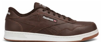
RBMX4159 CLUB MEMT WORK CAFÉ DIELÉCTRICO TALLAS 25-31 MEX