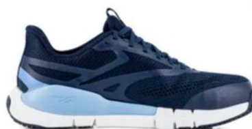
RBMX513 FLEX TRAINER WORK DAMA TALLAS 22-27 MEX