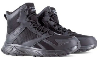
RBMX6650 HYPERIUM TACTICAL TALLAS 25-31 MEX