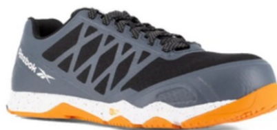
RBMX4453 SPEED TR WORK ANTIESTÁTICO TALLAS 25-32 MEX