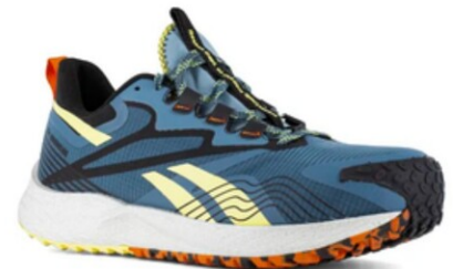
RBMX3611 FE4 ADVENTURE WORK DIELÉCTRICO TALLAS 25-32 MEX