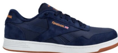
RBMX4156 CLUB MEMT WORK AZUL DIELÉCTRICO TALLAS 25-31 MEX